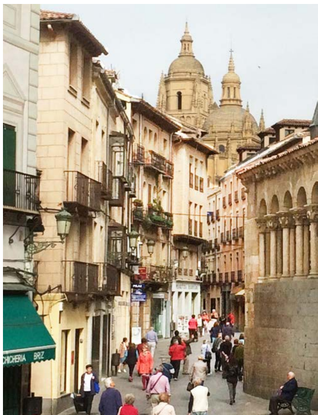
▲ 走过窄巷通往塞市主座堂