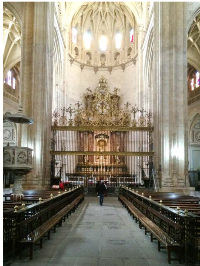
▲ 从塞市主座堂正厅望向祭台